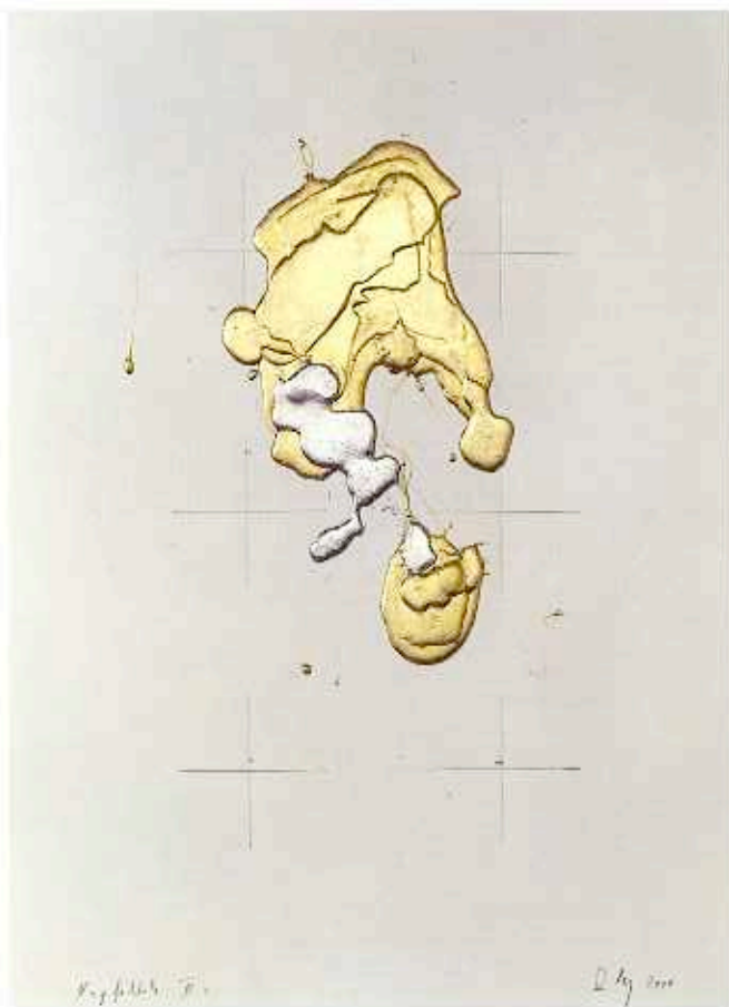
NAPFOLYOK II., 2000. 80x60 cm papír, műanyag és fémbevonat (magántulajdon)

Az Univerzum lényege az átváltozás. Ha az Univerzum egy-egy magányos szigetén megjelenik az ember, vele új lényeg lép a színre: az átváltoztatás.