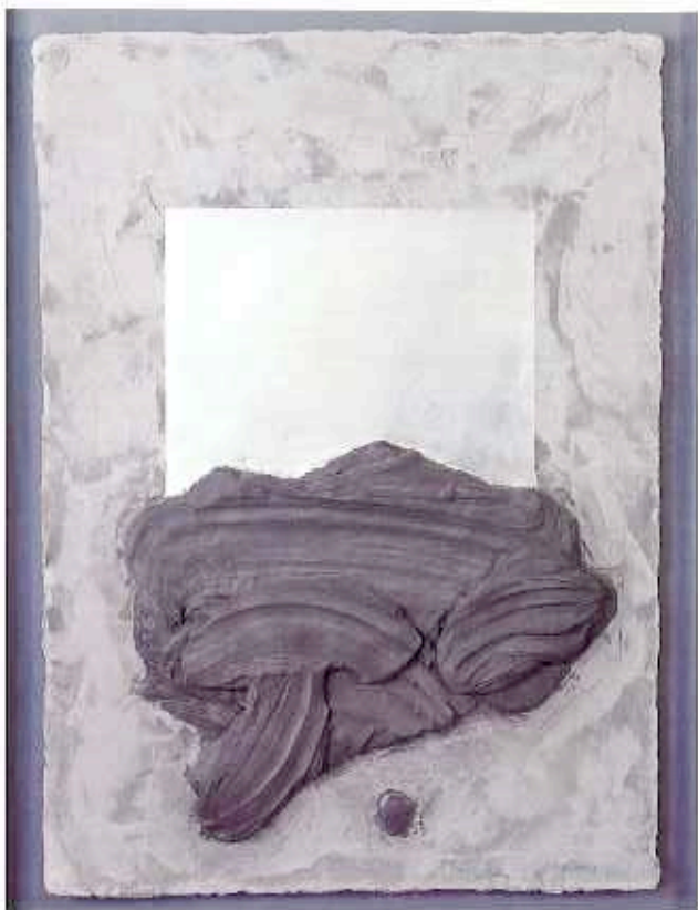
EZÜSTHID, 2001. 120x160 cm gipsz és fémbevonat (megérintve)

A címleptető: SPACE NIGHT II, 2001. 100x100 cm papír, műanyag és fémbevonat (megérintve)