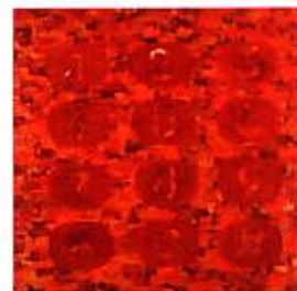
Braun András: Hívj most, 1995

európai kortárs művészetről is. Így sikerült elérnie, hogy bizonytalan döntéseket hozzon, s gyűjteménye a minőség biztos kritériumára épülhetett. Megalapozott döntéseinek eredményeképp egy rendkívüli és sokoldalú, a magyar kortárs művészet szinte minden jelentős alkotóját felölelő kollekciót sikerült létrehoznia.