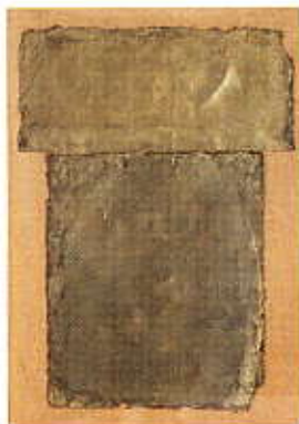
Záborszky Gábor: Aranykor, 1989

A műgyűjtés hagyománya, az, hogy az emberek műalkotásokkal – képekkel, szobrokkal – veszik körül magukat, és olyan környezetet alakítanak ki, ahol újabb és újabb műtárgyak jelennek meg, kezd újra meghonosodni Magyarországon.