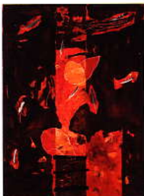
Klimó Károly: Tűz és tollak, 2008