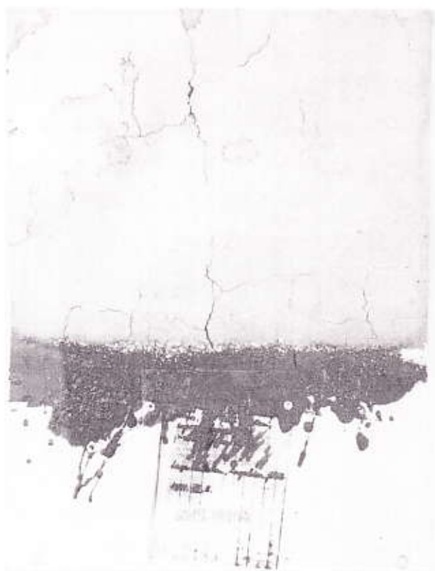
RADNÓTI EMLÉKLAP II 1984; 70x50 cm; vegyestechnika Petőfi Irodalmi Múzeum tulajdona