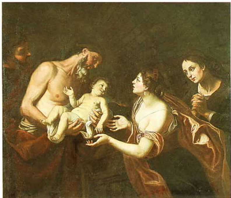
165. Ilés feltámasztja a careftal özvegy fiát, 1690 körül

vászon, olaj, 131,5x154 cm, Ltsz.: 54.29.