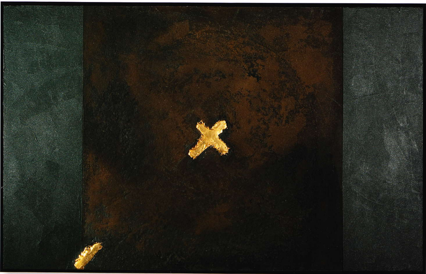
Felkiáltójelek • Exclamation Marks • 2010

Vegyes technika • Mixed technique • 80x60 cm