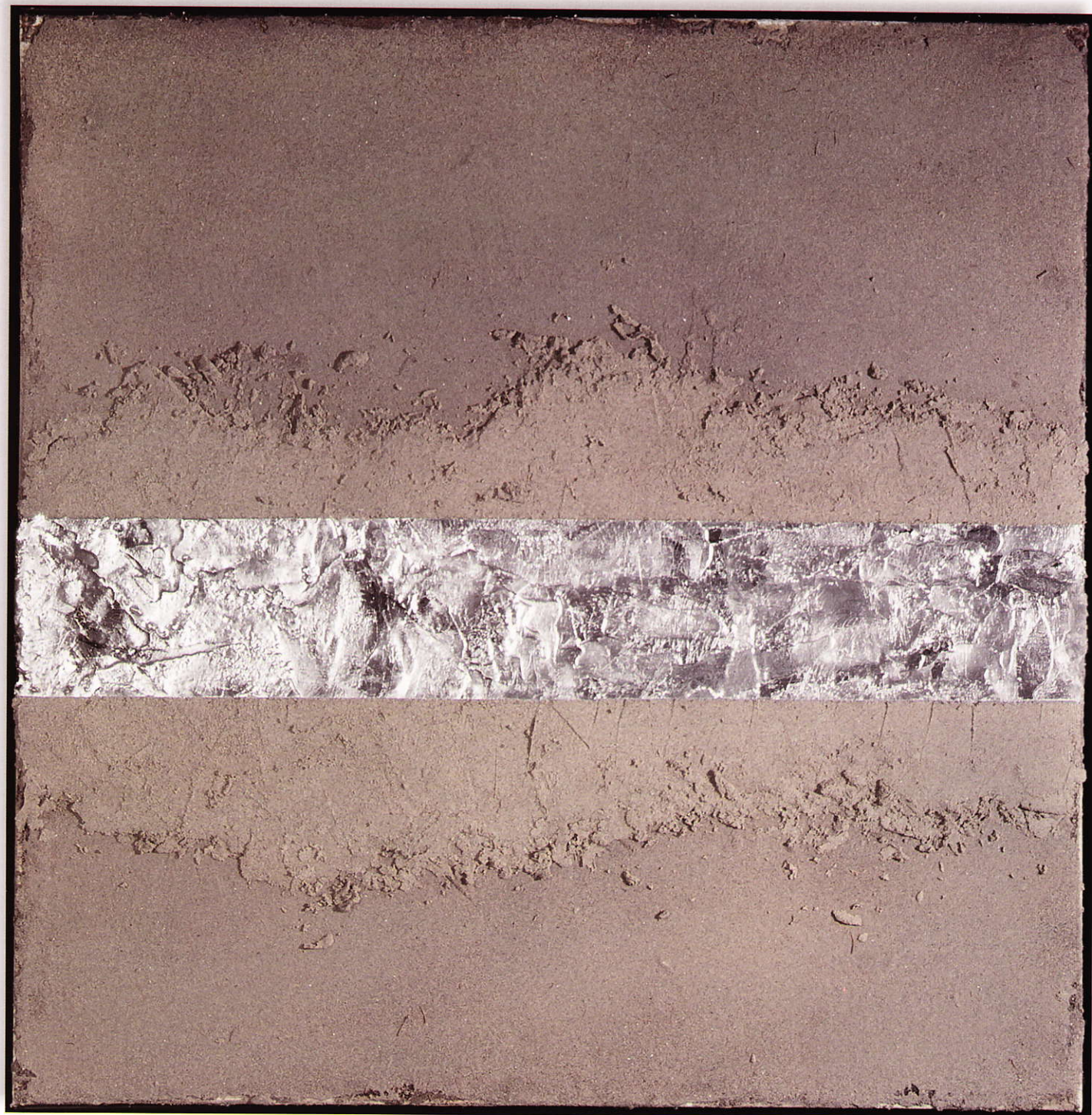
korlátozott mozgáster • Restricted Room for Maneuver • 2012 egyres technika • Mixed technique • 120x120 cm