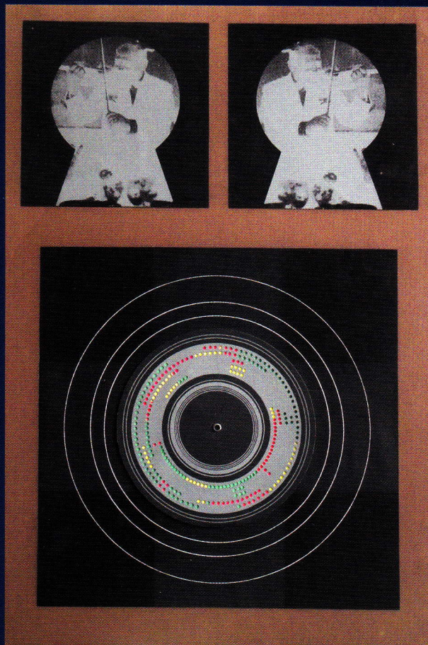
KOCSIS IMRE Zenegép, 1972