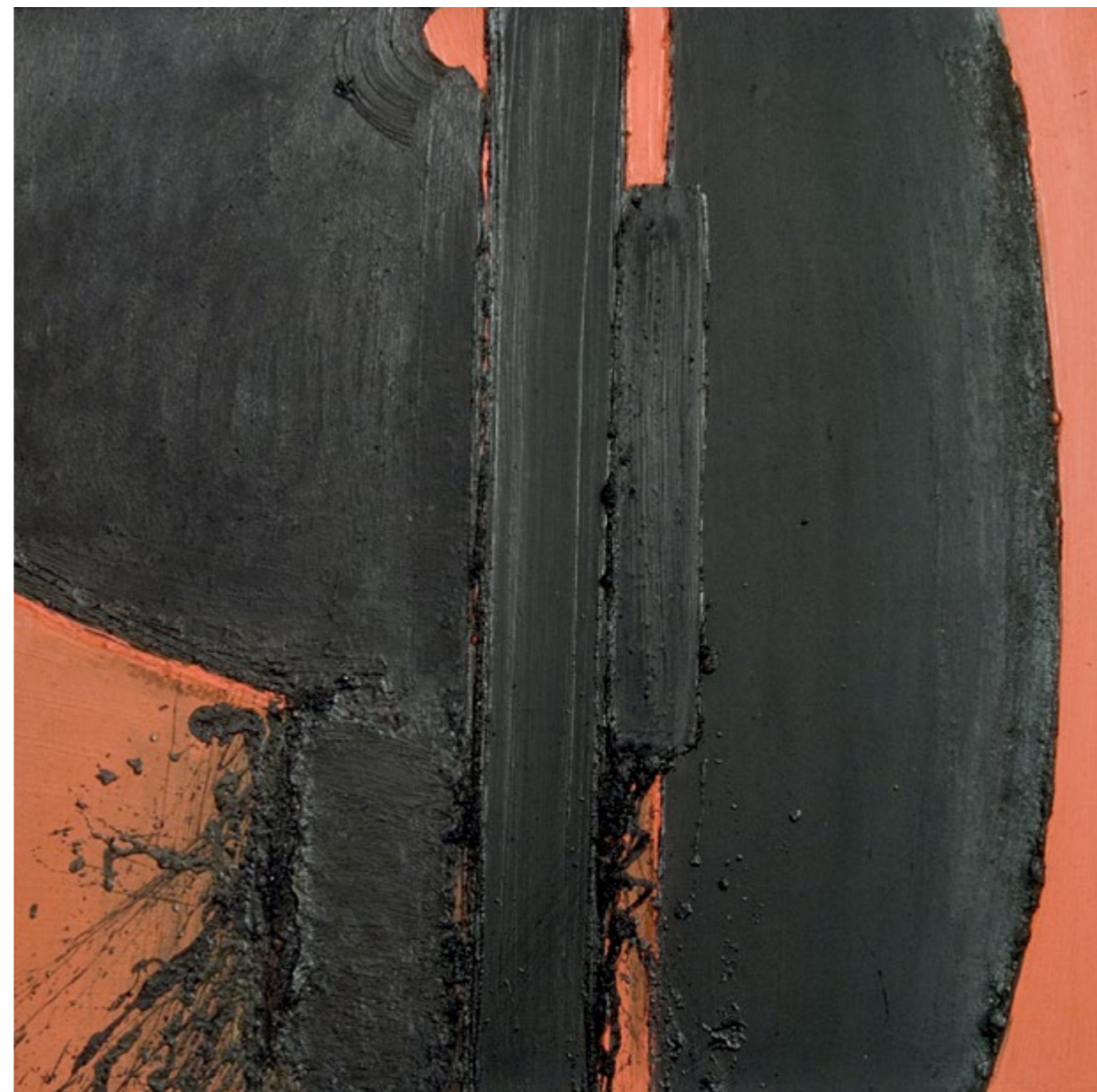
Ikarusz, 1976 olaj, farost / oil on wood fibre, 80 x 80 cm Fiatal képzőművészek Stúdiója Alapítvány gyűjteménye / Collection of the Studio of Young Artists Fondation, Budapest