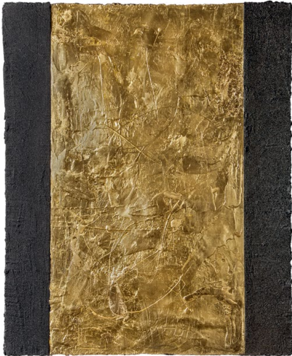
Fényzuhatag / Waterfall Light, 2008 vegyes technika / mixed media, 100 x 80 cm