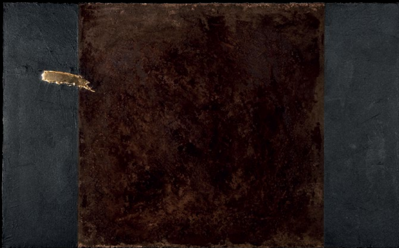
Kezdődő geometria / Opening Geometry, 2010

vegyes technika / mixed media, 100 x 160 cm