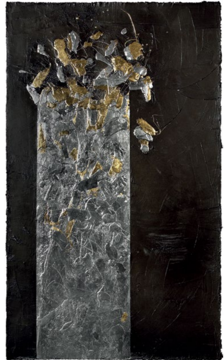
Mint oldott kéve – Féltorony / Half Tower, 2014 vászon, akril, fémbevonat / canvas, acryl, metal coating, 200 x 100 cm