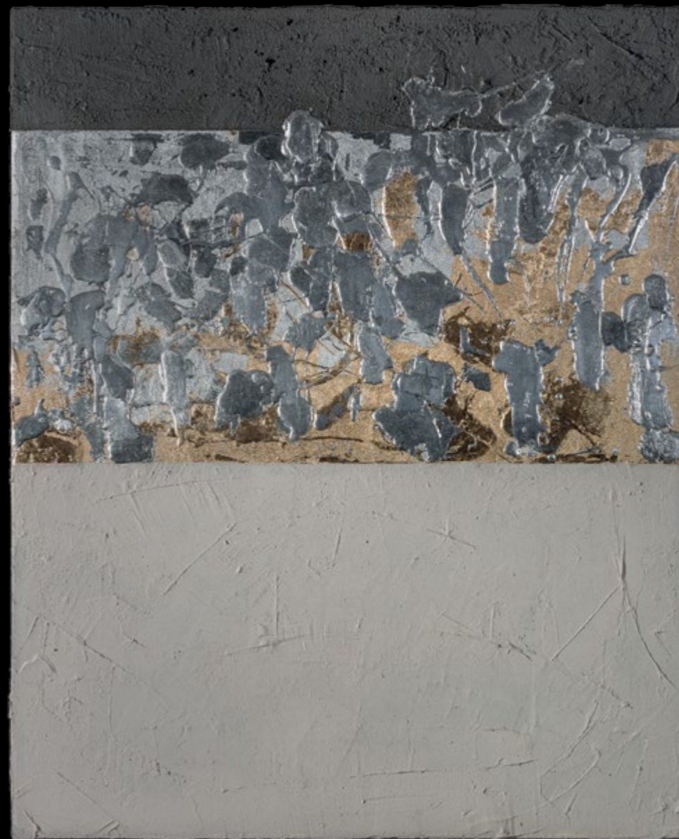
Zsákba gesztus / Gesture in a Pok, 2016 vegyes technika / mixed media, 100 x 80 cm