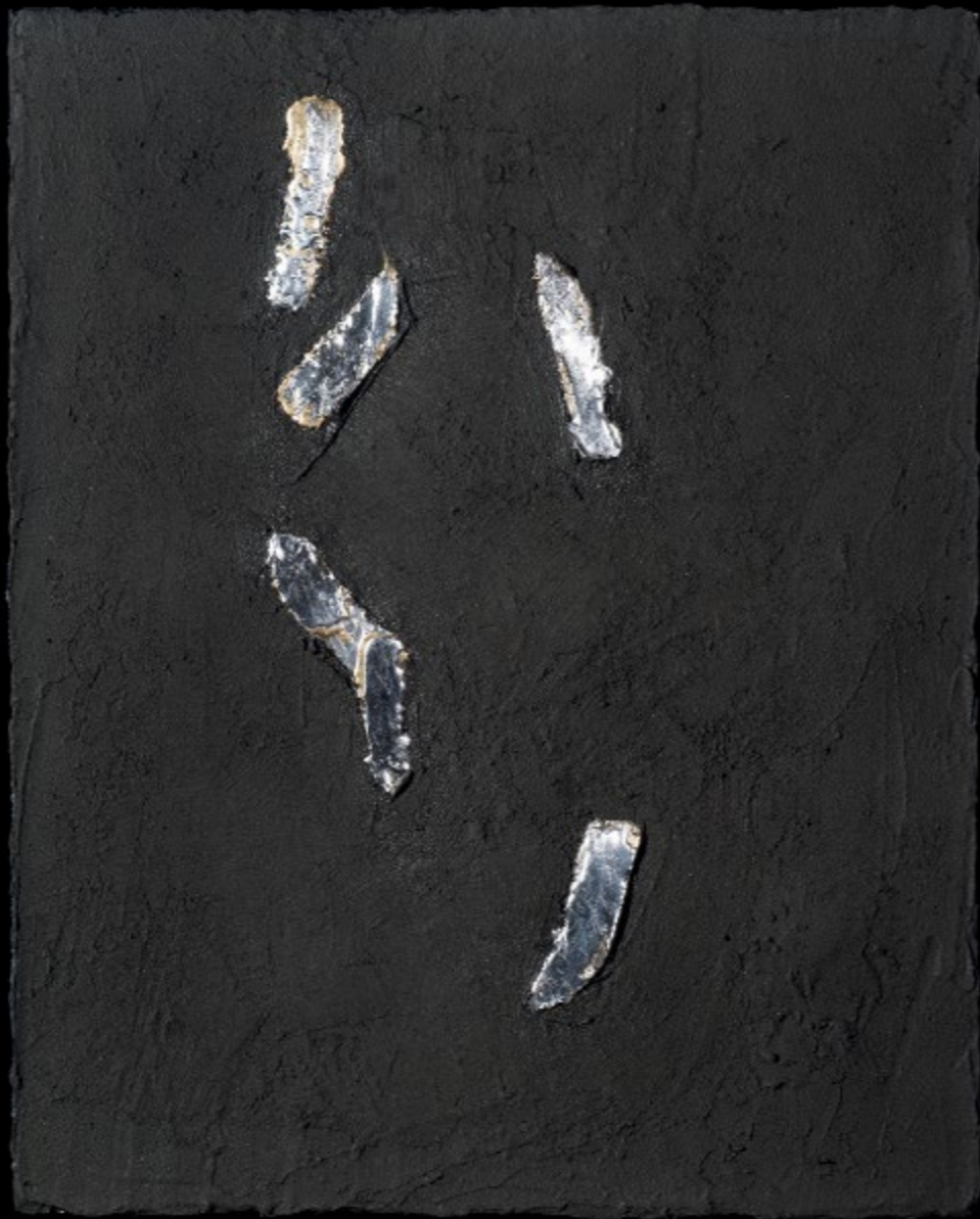
Hull a hó / It is snowing, 2016 vegyes technika / mixed media, 100 x 80 cm