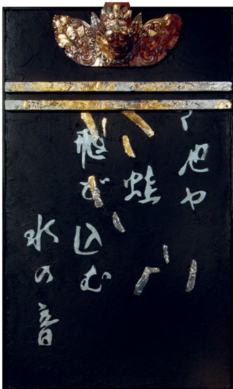
Az éjszaka démona / The Demon of the Night, 2014 vegyes technika, kollázs / mixed media, collage, 200 x 120 cm