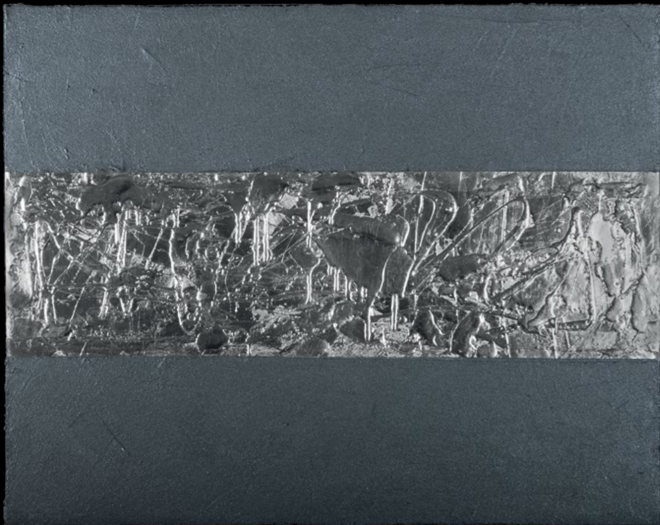
Korlátozott mozgástér / Narrow Margin, 2012

vegyes technika / mixed media, 80 x 100 cm