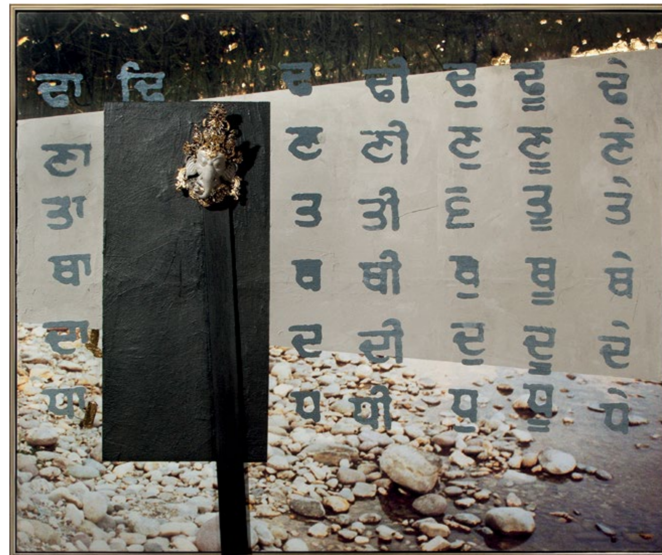
Ganesa-Elefántkirály / Ganesa-Elephant King, 2014 vegyes technika / mixed media, 204 x 240 cm