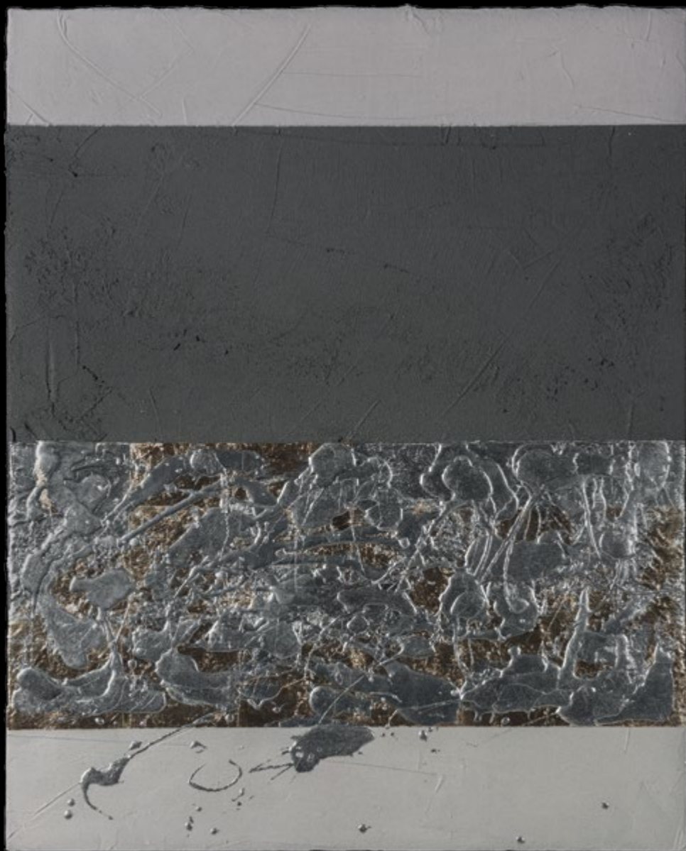
Kiszóródó / Spill, 2016 vegyes technika / mixed media, 100 x 80 cm