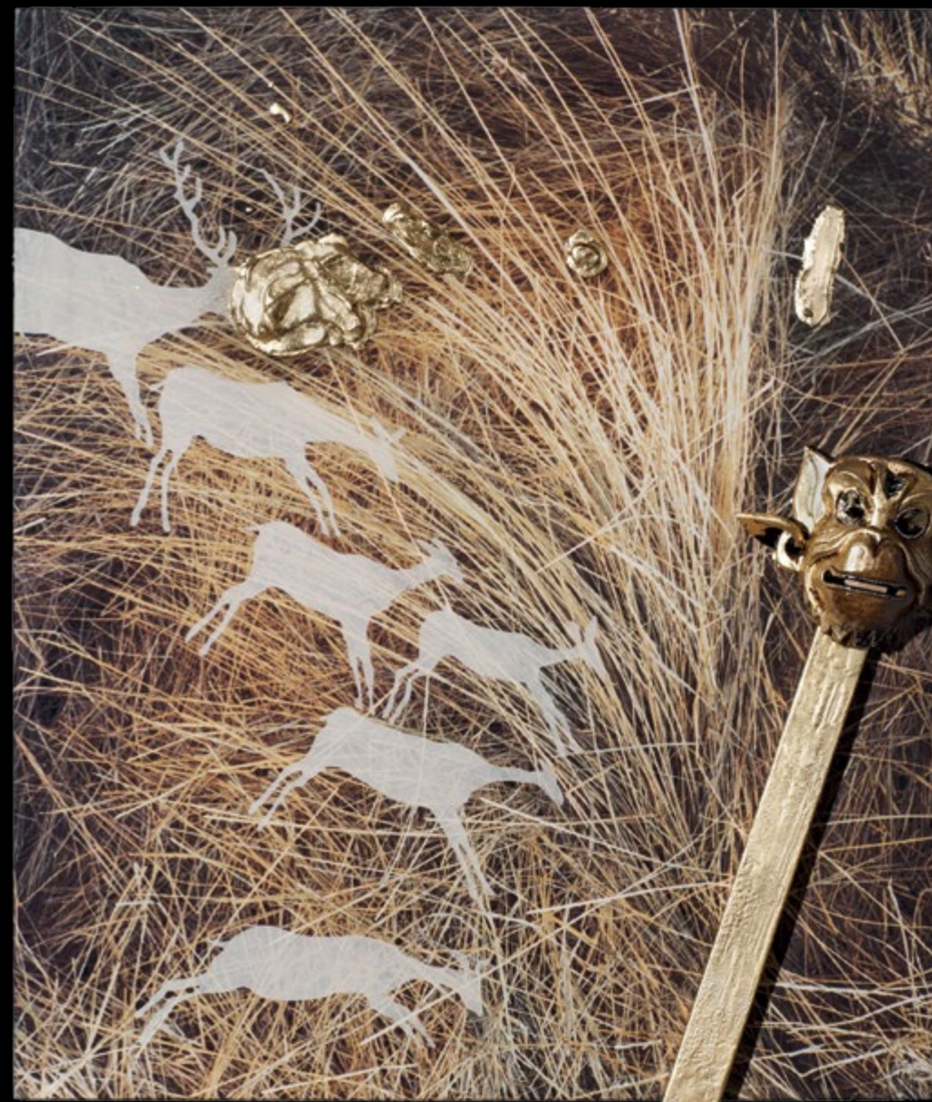
Hanumán, 2016 vegyes technika / mixed media, 120 x 100 cm