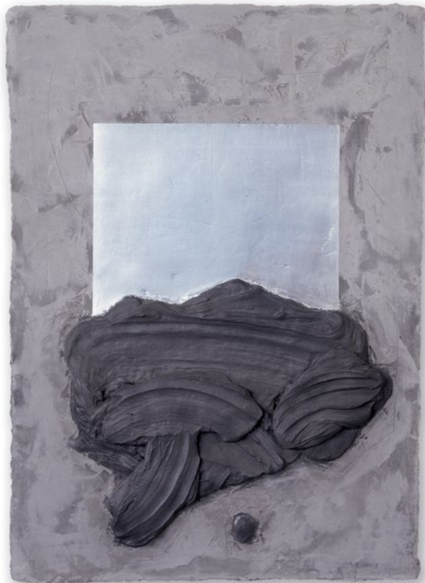
Ezüst híd / Silver Bridge, 2001

vegyes technika, mixed media, 150 x 110 cm