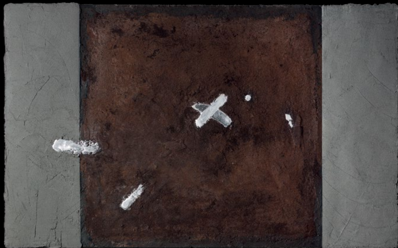
Szomorú kép / Tristful Picture, 2011-2016

vegyes technika / mixed media, 100 x 160 cm