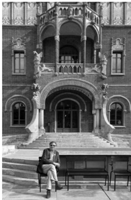
Barcelonában, a Szent Kereszt és Szent Pál Kórház előtt, 2016.