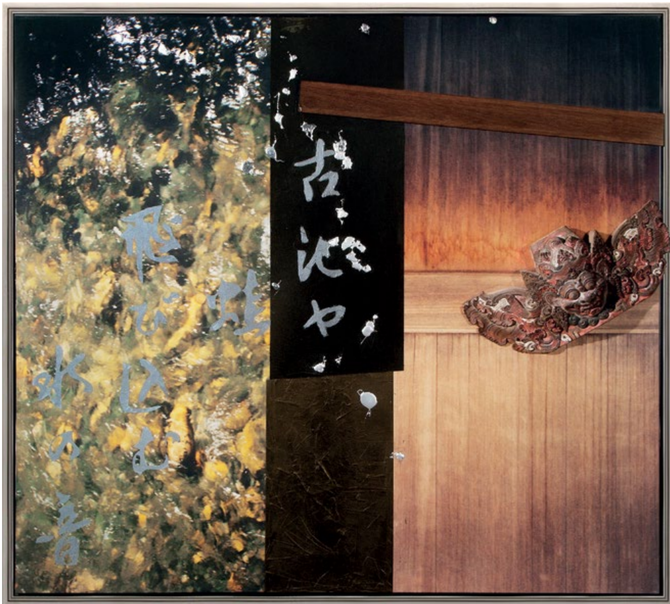
Bali démon / The Demon from Bali, 2014 vegyes technika / mixed media, 180 x 200 cm