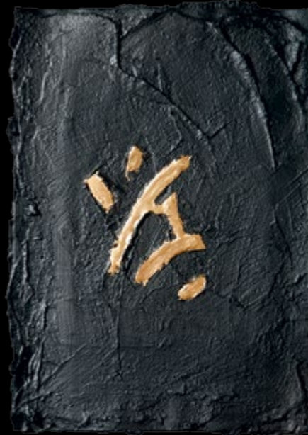
Mozgások a műteremben A-D / Movements in the Studio A-D, 2012-2015

vegyes technika / mixed media, egyenként / pcs 70 x 50 cm