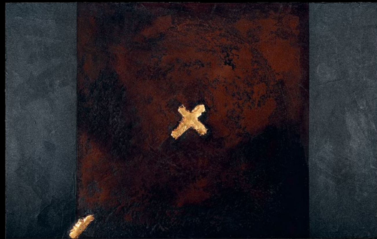
A közép keresése / The Search of the Middle, 2011

vegyes technika / mixed media, 100 x 160 cm