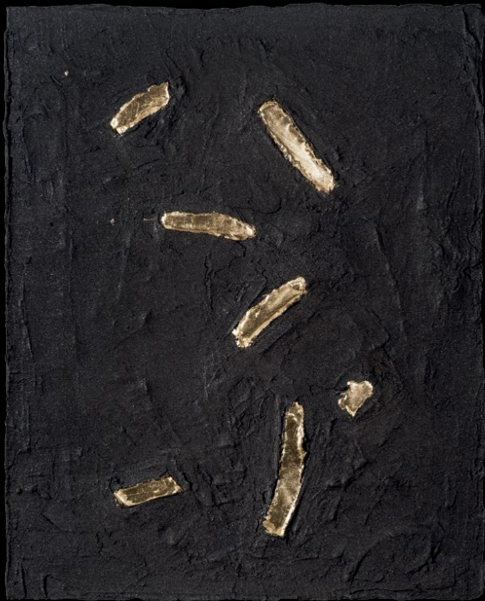
Rendezetlen gesztusok / Inordinately Gestures, 2016

vegyes technika / mixed media, 100 x 80 cm