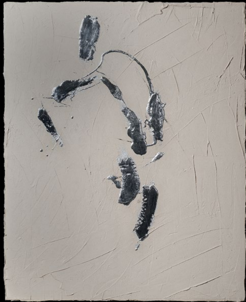
Bukdácsoló / Tumbling, 2016 vegyes technika / mixed media, 100 x 80 cm magántulajdon / privat property