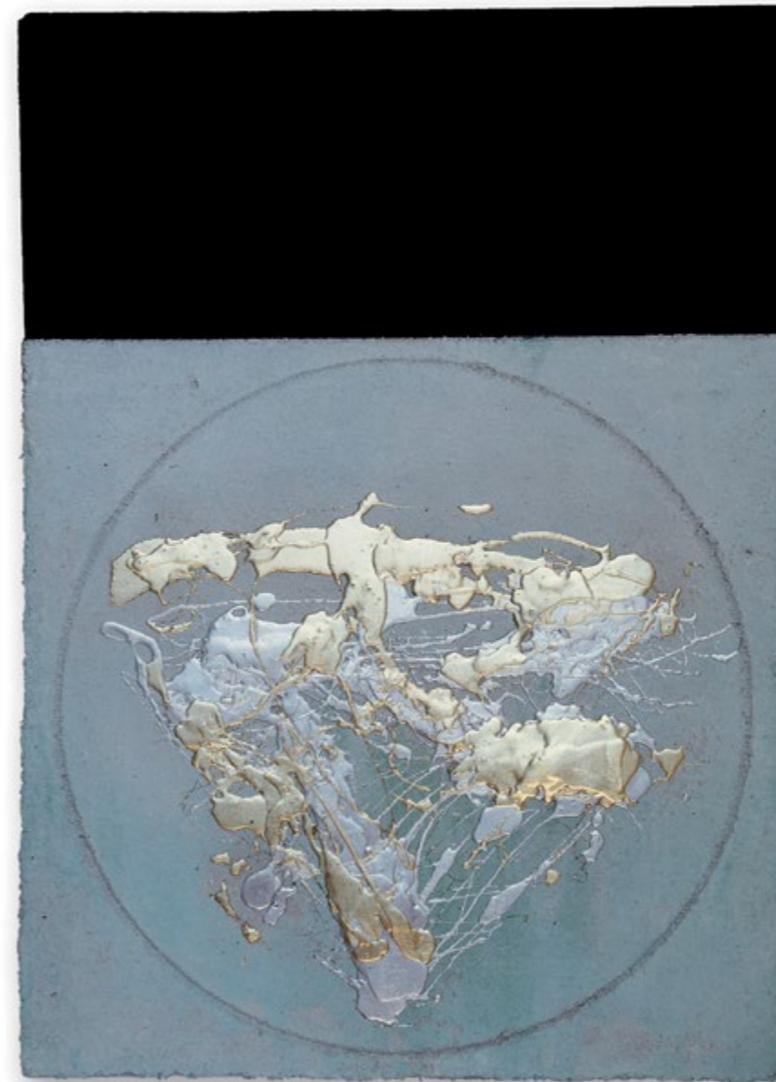
Pollock a nagyító alatt / Pollock under a Magnifying Glass, 2001

Az Arhívum tulajdona / The Arhívum's Collection, Budapest